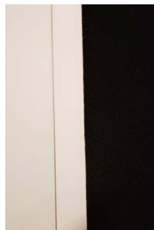
Med 15 mm kantbånd