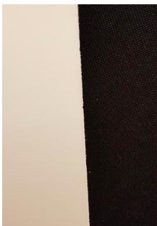
Med tape og forskæring af front