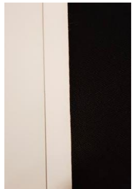
Med 15 mm kantbånd